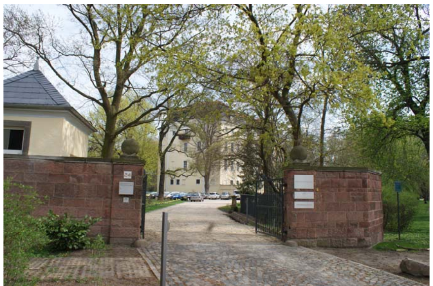
Foto der Schlosseinfahrt